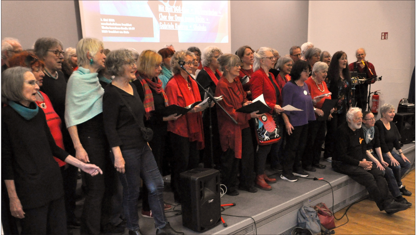
Und dann die „Jam-Session“: alle drei Chöre gemeinsam auf der Bühne