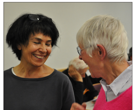
Nach der Pause der dritte Chor: die Omas gegen rechts