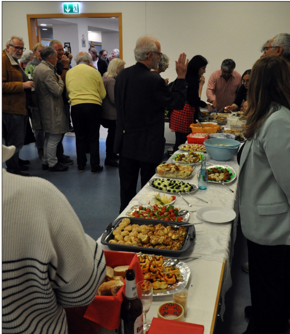
Hefiges Gedränge vorm Buffet; das Warten lohnte sich.