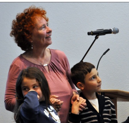
Beste Stimmung im Saal bei Jung und Alt