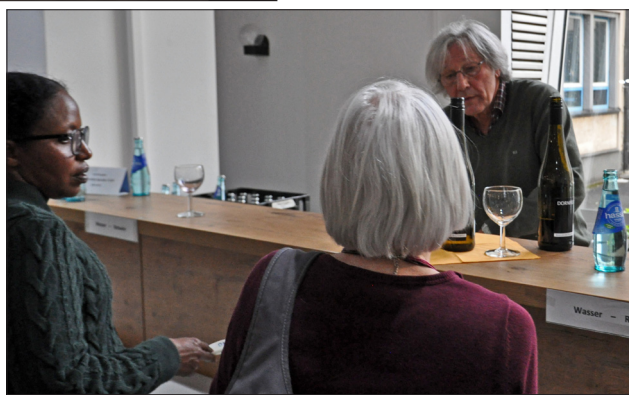
Auch außerhalb des Saals geschah Wichtiges: die Versorgung mit Getränken – und später mit Speisen.